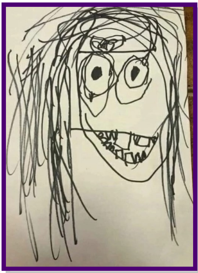
Мама с мозгами

Когда я приехала с обучения, дома меня ждали два портрета Мамы. Художник— счастье в семье. Покажу вам несколько портретов: с мозгами и без мозгов. Как Вы считаете, мозги украшают женщину или всё-таки без них лучше?