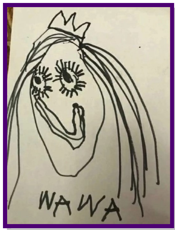
Мама без мозгов